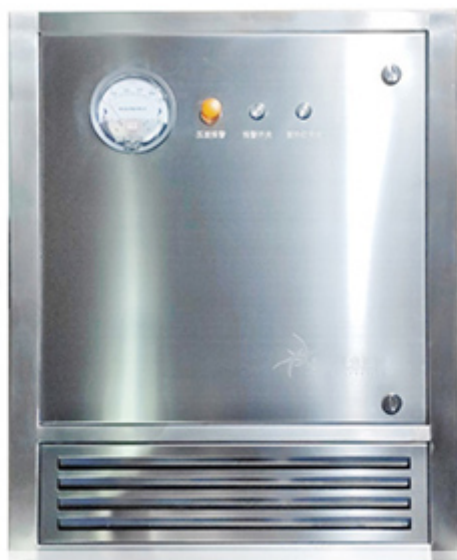
苏州凯尔森气滤系统有限公司

苏州凯尔森提供的高效排风口，配置有测试口和消毒口，可以进行原位在线消毒，原位测试。操作简单方便，减少人员配置，节约成本和时间。高效排风口的消毒口、取样口、发尘口排列在箱体内部的箱体内部过滤器的一侧，空间设计合理，操作方便。而且消毒口和取样口/发尘口都选用优质的防腐防锈的不锈钢材质，强度和坚固性都很好，光滑不沾尘易清洁，为了易于分辨每个接口的名称和具体作用，我们特别为每一个接口贴上高清标签，让操作者一眼就明白每个接口的功能。上海低泄漏高效回风口报价高效回风口的接口方式有顶接和侧接之分。